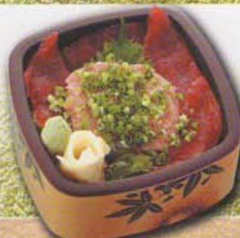
ネギトロ鉄火丼 1,600円