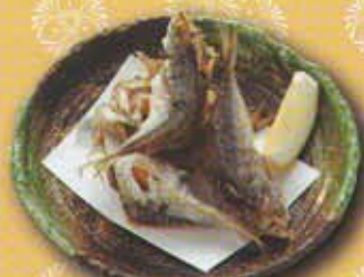
小アジ生干揚げ 500円