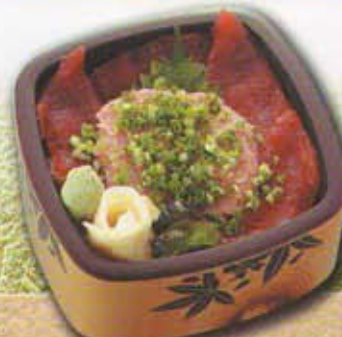
ネギトロ鉄火丼 1,600円